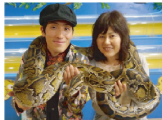
脂汗たくさんでした。

沖縄と言えば「ハブ」が有名ですが、こちらの「ハビ」(まむし)とはクサリヘビ科で同じ仲間だそうです。別物だそうです。かつて「ハブ対マングース」のショーで