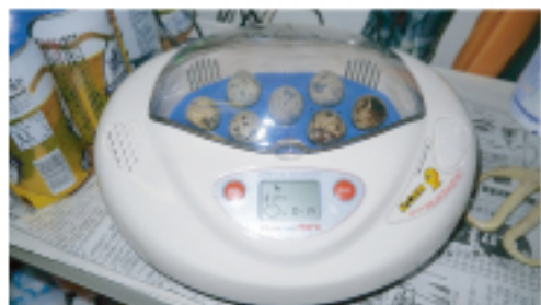
購入した孵化器です。フカミでは売ってません

最近できた「エヴァーグリーン」はどうなんでしょうかね?? また成功したら雛をみせてくださいね!