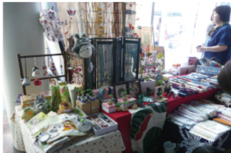
初めての出店。それなりに雰囲気出てますか？

7月22日、新庄のBigUにて開催された「癒しフェスティバル」のイベントに、和雑貨「ふかみ」として初めてのフリーマーケットデビューをしました。ワクワクドキドキ、下見に下見を重ね、万全なる用意をして、いざ出陣！当日は天気にも恵まれて大繁盛の予感！？屋外ではすでに、ラーメン屋、たこ焼き屋、かまてん