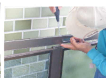
サッシはそのままガラスのみ交換します。