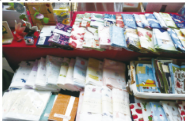
人気の手ぬぐいもズラリと陳列しました

準備・片付けは大変だったけど、出会うお客様とのやりとりはとても楽しかったですし、私たちも交代でイベント自体を楽しめましたので充実した一日を過ごせました。これから秋に入るとイベントが多くなると思います。皆さまも出かけてみてはいかがでしょうか？どこかでお会いできるかも？