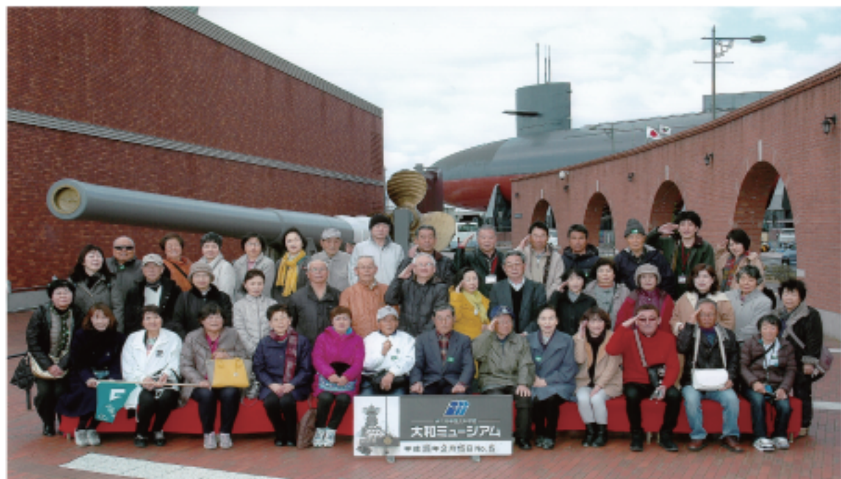
平成 28 年 2 月 15 日 和歌山電商友の会 於：大和ミュージアム

今年のお楽しみ旅行は、初めて参加の10名様を含めて総勢42名で行って来ました。道後温泉まではバスの車中が長いのですが、いつものようにビンゴゲームやクイズなどで楽しめると、意外に早く到着するものです。クイズでは息子がパソコンを駆使し、驚きの趣向でうならせしてくれました。その場で見た方しかわかりませんがホンマ凄かった！ 興奮の、現金総取りじゃんけん合戦も力が入り、新チャンピオンの誕生です。漢字読み当てクイズや到着時間当て等で、賞金の1億円の札束を手にした方も居られ、フカミは出血大サービス ホンマやで！