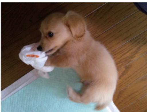
ナイロン袋がお気に入り