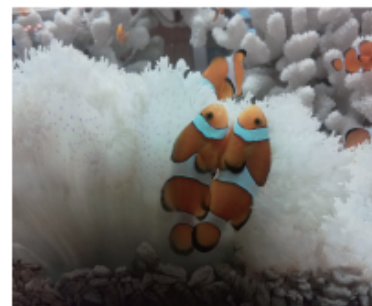
可愛いクマノミちゃん

ある日の散歩の足元に白く可愛い、まるで妖精コロポックルが隠れていそうなきのこが生えていて、草むらにはいつくばって、はい、パシャ!