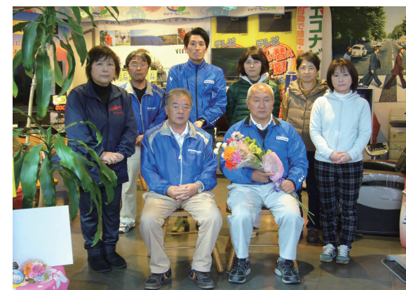
ちょっぴり寂しい記念写真