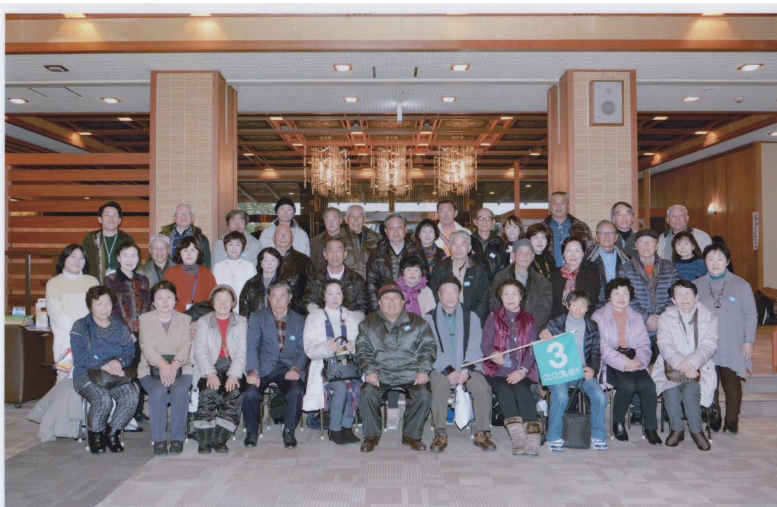
和歌山電商友の会 平成29年1月29日 於 越中 金太郎温泉