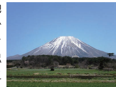
西日本の富士山といわれています

登山初体験は2年前、西日本で一番高い石鎚山へ地元の有志の方と登頂したのが始まりでした。それから山に魅了されて、去年は大峰山を17キロ制覇して、今年のゴールデンウィーク(GW)は登山をしたいと思い立って、学生時代の友人と鳥取県大山を登山することにしました。「東の富士山、西の大山」と言われるように、そびえ立つ姿は堂々たるもの。ホームページにも「初心者～中級者向き」と書いてることもあり、初心者の集まりでも何とか登ることになったのですが、それはそれは手ごわい山でした。平均斜度は8.1度(ずーっと見上げるような坂道)、そして1合目からの登山で標高差約900m 0.5合ずつ休憩して、この日なら食べても罪悪感を感じないから手持ちの「かりんとう」をバクバク食べてしまいます。