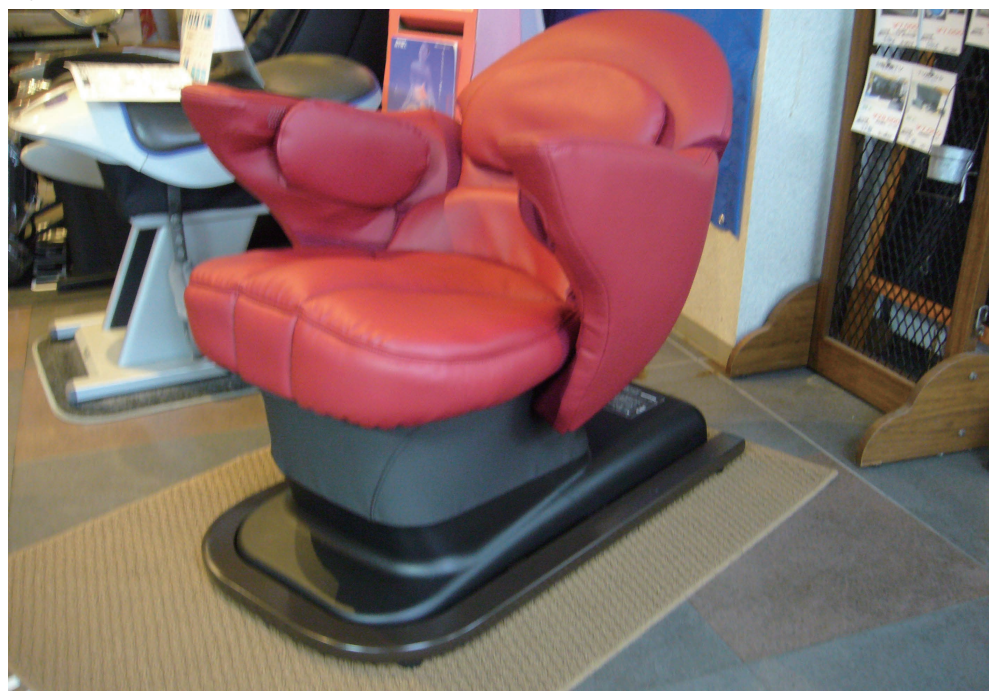
写真の赤とブラウンの2色 可愛くて場所取らないよ