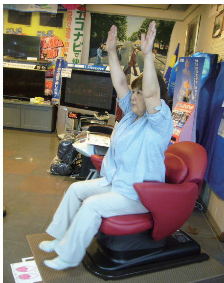
やってる やってる

気楽に試して頂けるようにお店に置いてありますので、どうぞお乗りください。みんなで痩せましょうよ。