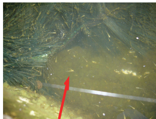
白い棒状の稚魚たち

5月初め、泉水がバシャバシャと騒がしいので慌てて覗くと、どうやら鯉の産卵が始まったようで、激しい追い込みが行われている。数年に一度、産むが、いつもはそのまま鯉たちが食べるままに放っておいたが、久しぶりに少しだけ孵化させてみようかと興味半分挑戦することになった。過去一度だけ挑んだ経験があるが、その時は多すぎて、後から後へとどっさり孵化する稚魚を古い風呂釜やらタライやらいくつもの容器に分けて大騒ぎの末、10匹ほどが残った程度で惨敗 😞